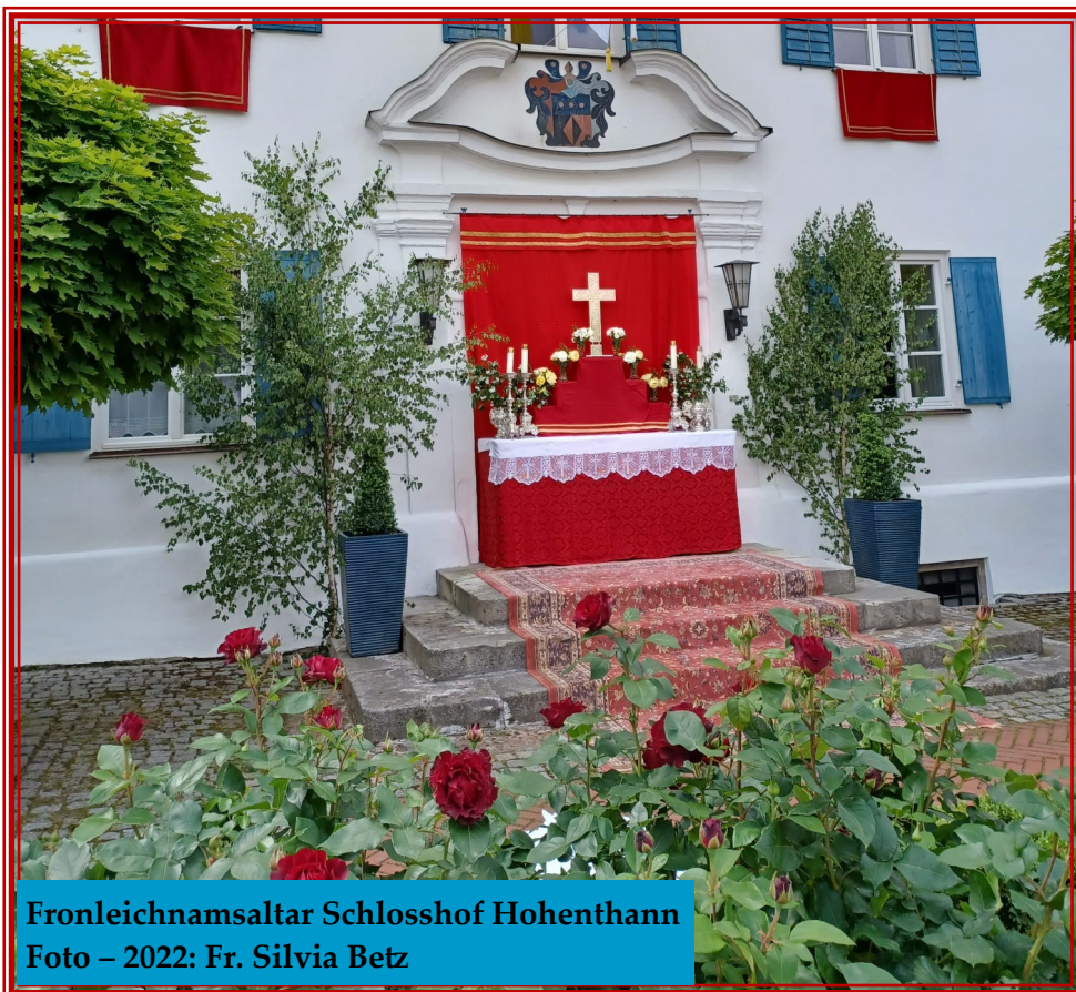
Fronleichnamssaltar Schlosshof Hohenthann